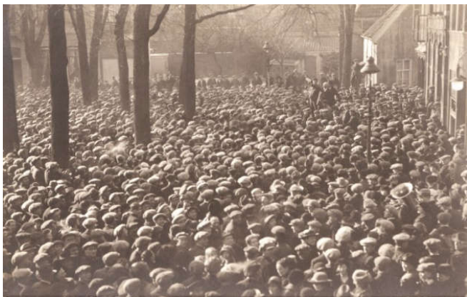
Stakende textielarbeiders in Twente

Rond 1930 zijn de werkomstandigheden van Twentse textielarbeiders slecht. Ze moeten langer werken dan andere arbeiders en verdienen ook nog eens minder. Tijdens een grote economische crisis besluiten de 'textielbaronnen' de lonen van hun werknemers te korten. De arbeiders komen in opstand en leggen het werk neer. Hoe loopt het af?