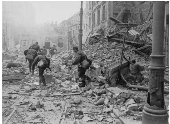
Duitse militairen tijdens de opstand in Warschau

In 1944 nemen Poolse verzetsstrijders in Warschau de wapens op tegen de Duitsers die hun land bezet houden. Daarbij komen 18.000 opstandelingen, 150.000 burgers en 17.000 Duitse soldaten om. Waarom zijn de Polen de opstand begonnen?