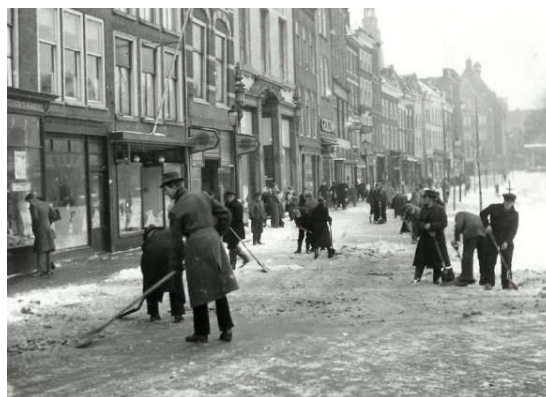
Sneeuw ruimen in Groningen