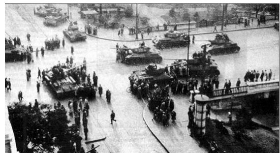
Russische tanks in het centrum van Boedapest

Aan het eind van Wereldoorlog II verjaagt het Russische leger de Duitsers uit de Oost-Europese landen. De Russen zorgen ervoor dat in die landen de communisten aan de macht komen. Zo ook in Hongarije. In 1956 komen duizenden Hongaren in opstand tegen hun regering. De Sovjetunie grijpt in en stuurt tanks. Hoe reageert Nederland?