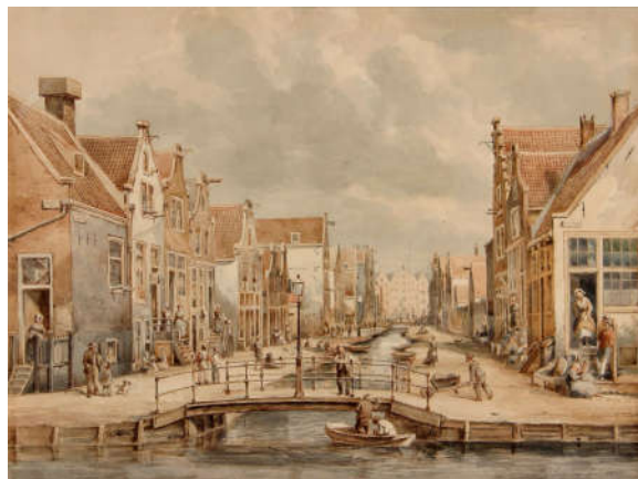
De Jordaan, Amsterdam

Zie voor het goede antwoord: 1845-R (lees ook het bericht dat er onder staat!)