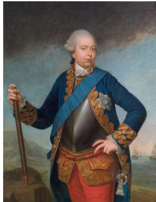
Stadhouder Willem V (1748-1806)