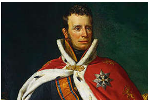
Koning Willem I der Nederlanden (1772-1843)

Op 30 november 1813 zet prins Willem van Oranje na achttien jaar weer voet op Nederlandse bodem. De laatste Franse bezetters verlaten het land. Niet veel later wordt de prins ingehuldigd als koning Willem I der Nederlanden. Iedereen blij, maar in 1830 ziet de koning toch grote problemen op zich afkomen. Wat is er aan de hand?