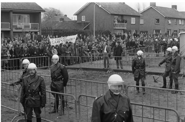
Politie probeert boeren in Tubbergen in bedwang te houden.

Het Twentse Tubbergen staat bekend als een vredelievend dorp. Maar in 1971 vechten woedende boeren met de rijkspolitie in de felste boerenopstand uit onze geschiedenis. Ze gooien brandbommen en spuiten een giertank leeg op de ME. Wat is er aan de hand?