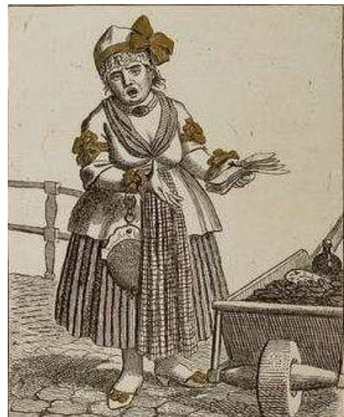
Catharina Mulder, alias Kaat Mossel (1723-1798)

In deze tijd is Willem V stadhouder van de Republiek der Zeven Verenigde Nederlanden, ons land dus. Hij is niet erg populair. Ons land is in oorlog met Engeland. Willem is familie van de Engelse koning.