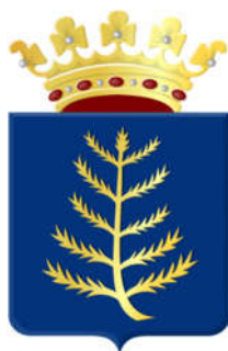
Wapen van Rijssen

In 1845 is het onrustig in Rijssen. Om de orde te herstellen worden zelfs soldaten ingekwartierd. Wat zou er aan de hand zijn?