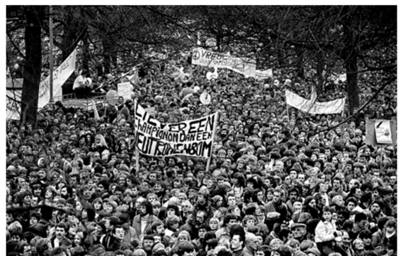
400.000 mensen protesteren in Amsterdam

Op 21 november 1981 lopen in Amsterdam 400.000 mensen mee in een protestmars: de grootste demonstratie in ons land ooit. Waar zijn ze tegen?